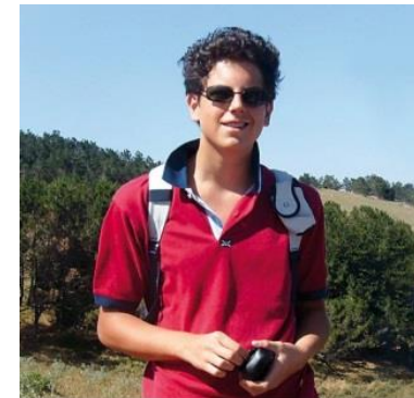
Blaženi Carlo Acutis